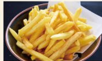
フライドポテト 490 (込539)