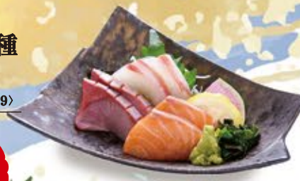
刺身3種盛合せ 790 (込869)