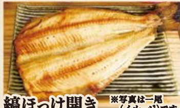
縞ほっけ開き ※写真は一尾(イメージ)です。 <片身> 680 (込748) <一尾> 1,260 (込1,386)