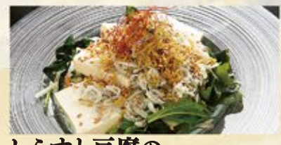
しらすと豆腐の胡麻塩サラダ 490 (込539)