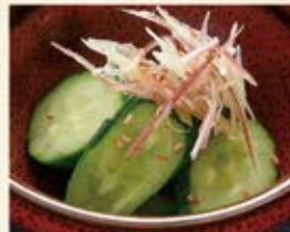
浅漬けきゅうり 290 (込319)