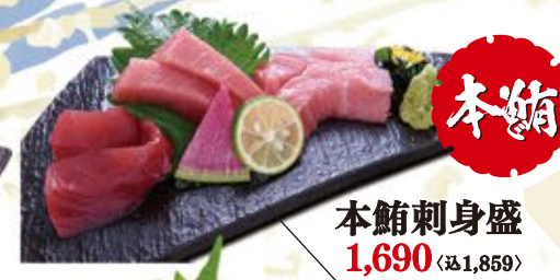
本鮪刺身盛 1,690 (込1,859)