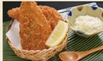
あじフライ 390 (込429)