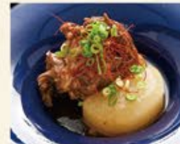
本鮪あらと大根煮 450 (込495)