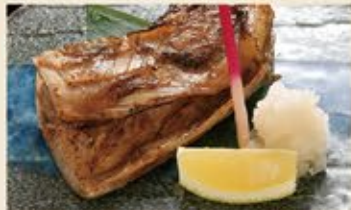
本鮪カマ塩焼 売切御免 690 (込759)