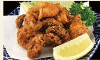
たこの唐揚げ 590 (込649)