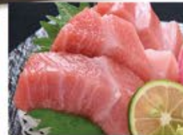
本鮪 大トロ 980 (込1,078)