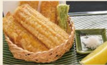
とうもろこし天ぷら 490 (込539)