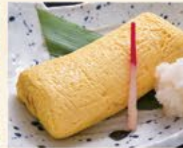
出汁巻 490 (込539)