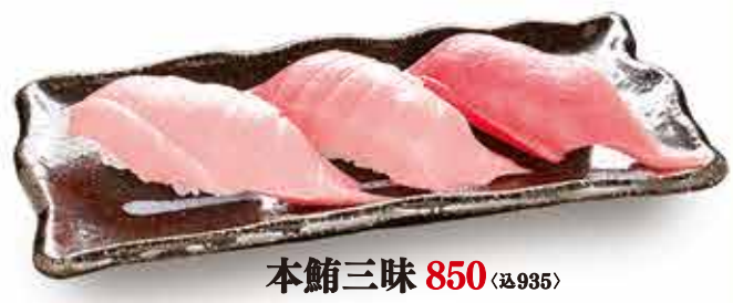
本鮪三味 850 (税込935)