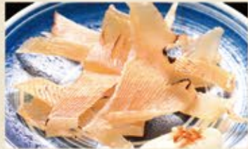
エイヒレ 390 (込429)