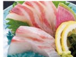
鯛刺身 590 (込649)