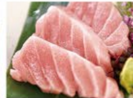
本鮪 カマトロ 1,290 (込1,419)