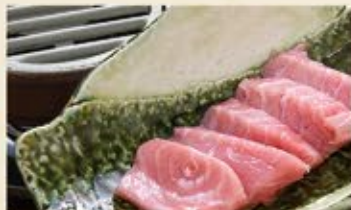
本鮪ツノトロ炙りねぎおろしポン酢 930 (込1,023)