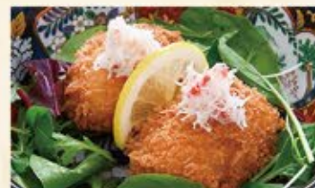
カニクリームコロッケ 490 (込539)