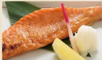
銀鮭ハラスと大根おろし 640 (込704)