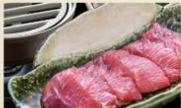
本鮪ほほ肉炙りねぎおろしポン酢 930 (込1,023)