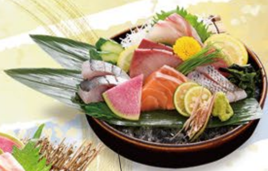
刺身5種盛合せ 1,290 (込1,419)