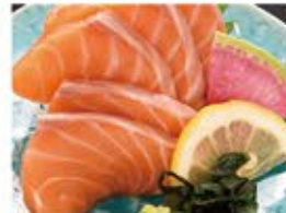
オーロラサーモン刺身 790 (込869)