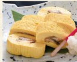
う巻 鰻入り出し巻き 690 (込759)