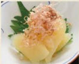
味付数の子 390 (込429)