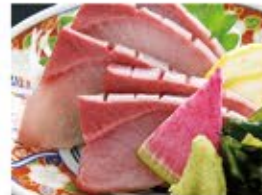
かんぱち刺身 690 (込759)