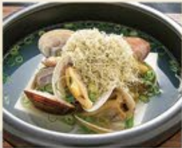
あさり出汁の湯豆腐 490 (込539)