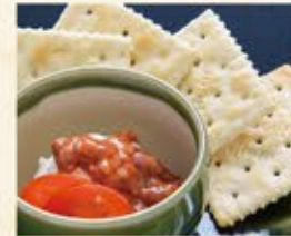
クリームチーズの鮪酒盗ディップ 490 (込539)