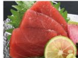
本鮪 赤身 790 (込869)