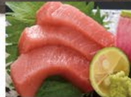
本鮪 中トロ 890 (込979)