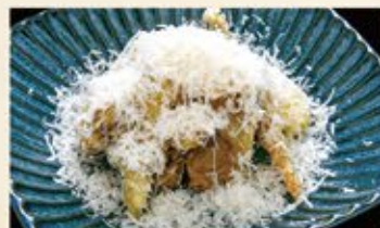
舞茸パルミジャーノ・レッチャーノ 390 (込429)