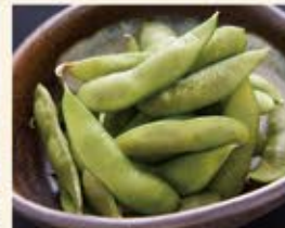
茶豆の枝豆 390 (込429)