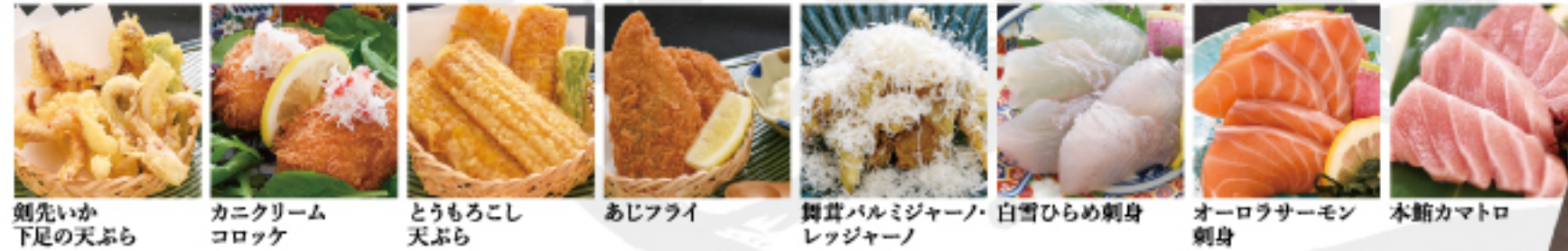
剣先いか下足の天ぷら