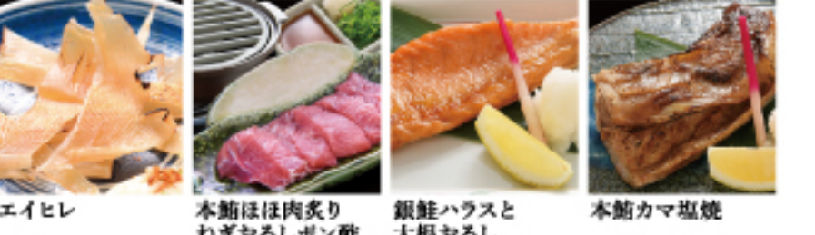
本鮪ほほ肉炙りねぎおろしボン酢