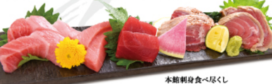
本鮪刺身食べ尽くし