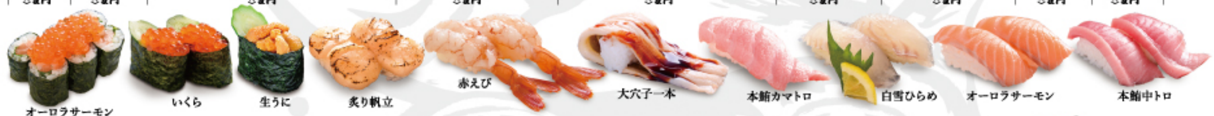
オーロラサーモンいくら巻